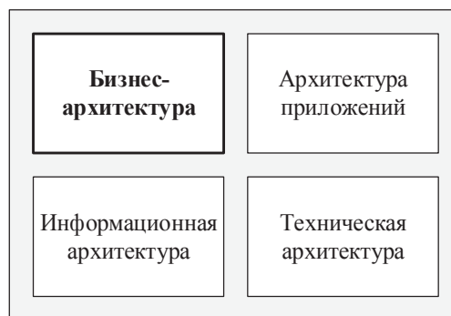
Рис. 1. Архитектура предприятия с учетом модели TOGAF

Особенность модели TOGAF заключается в том, что предприятие рассматривается как континуум архитектур (Enterprise Continuum) [6], состоящий из набора готовых моделей, которые максимально обобщены и сгруппированы по уникальным или специальным направлениям (рис. 2). Процесс создания архитектуры предприятия рассматривается как переход от общей архитектуры к специализированной, что дает методика разработки архитектуры в модели TOGAF.